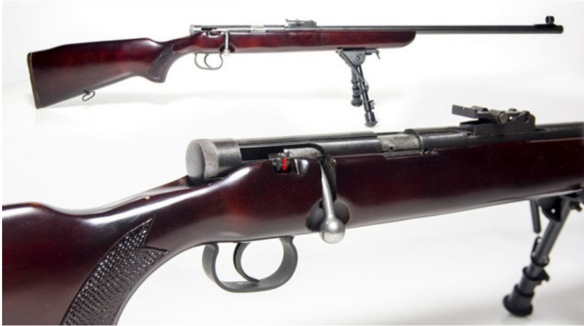
300) this.width=300" />