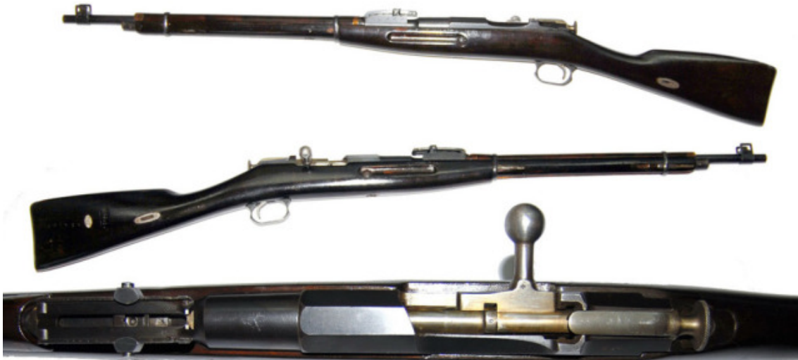
300) this.width=300" />

Η ιστορία της αμερικανικής πυροβολικής είναι πολύ ενδιαφέρουσα, και ο σκοπός της ιστορίας είναι να ενημερώσει τον αναγνώστη για την εξέλιξη της αμερικανικής πυροβολικής από την εποχή της εμφάνισής της μέχρι σήμερα.