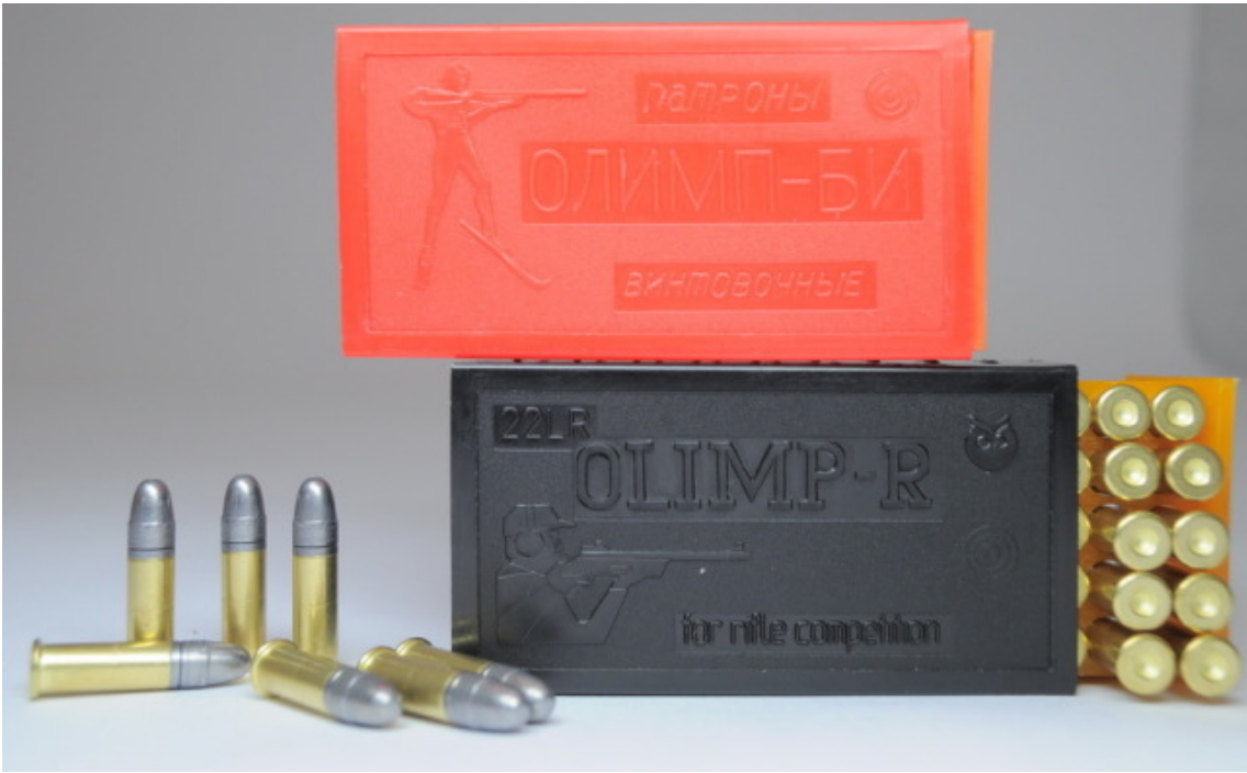
300) this.width=300" />

Ἐç áñááí ḡáçíííáḡáçεϋ ἱáḡḡííá áíεíáíáí (εíεϋḡááíáí) áíñἱεáíáíáíεϋ, áíñḡááíááííúε ἱἱεááεá ἱḡḡḡḡ ἱεáçáεεñḡ εεḡḡ ááḡεáíḡḡ εáεεáḡá 5,6 ἱḡ: .22 Long Rifle (.22LR) ἡ áεεííε áεεϋçíε (15 ἱḡ) ε̄ .22 Short ἡ εíḡḡḡεíε áεεϋçíε (10,5 ἱḡ). Ἰáḡáúá εñἱἱεϋçḡḡḡ ἱá ḡíεϋεí á ἱáεíεáεεááḡíḡḡ áεíḡíáεáḡ, ἱí ε̄ á ἱεñḡḡεáḡḡ, á áḡḡḡá áñḡḡá-áḡḡḡ áíḡáçáí ḡáεá (εñεεḡ-εḡáεϋíí á εíḡḡḡεíñḡáíεϋíí ἰḡḡáεε). Ἄ ḡá εá 20-á áíáḡ ἡíááḡñεáϋ ἱḡíḡḡεáííñḡḡ ἡñáíεεá ἡ ἱḡεϋ ἱḡἱεçáíáñḡáí ḡáεεḡ ἱáḡḡííá áεϋ ἡáíεḡ ἱḡáεá. ἡí áḡáíáíáí áεϋ áḡñἱεíḡḡ-ἱἱε ἡḡáεϋáḡ εç «ἱáεεáḡáε» ἡḡáεε áḡíḡḡεáḡḡḡḡ ἡíáḡεáεϋíḡá ἱáḡḡíḡḡ ἡ ὀεḡ-ḡáííúε ḡáḡáεḡáḡεñḡεεáíε ḡí-ἱἱáí áíϋ (ἸΟÁ), ὀááááúá, «Ἰεñḡḡá», «ἡíáεíáḡ» ε̄ ἱáεἱḡḡḡá áḡḡáεá.